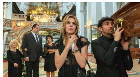
"AMMORE E MALAVITA", IL MUSICAL DEI FRATELLI MANETTI CHE CONQUISTA VENEZIA 74