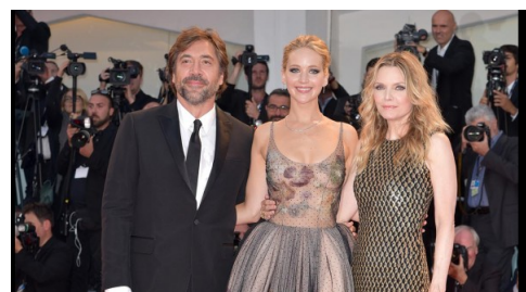
IL GIORNO DI JENNIFER LAWRENCE A VENEZIA74: TUTTE LE FOTO DEL RED CARPET DI "MOTHER!" CON JAVIER BARDEM